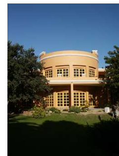
ORANGE House Tower mit Sonnendachterrasse

Darüber hinaus hat das ORANGE House auch Kurztrips zur OKAMBARA Elephant Lodge im Programm. Die Fahrt in das private Wildschutzgebiet dauert etwa 5 h. Dort gibt es jede Menge Lodge-Feeling und auf Game Drives (Wildbeobachtungsfahrt) können Elefanten, Leoparden, Geparden, Nashörner uvm. beobachtet werden.